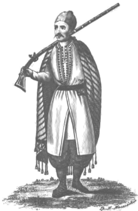
Вуко Юро Српски стравокъ Черногорскій.